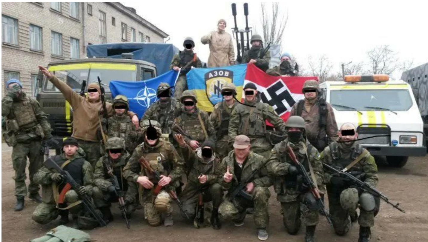
Azov fotografert 30. januar 2022.